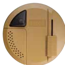
RONDÓ P LED Cod. RL1205/LED (10 pz)