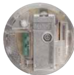
RONDÓ T LED Cod. RS5640/LED (50pz) Cod. RL5640/LED (10 pz)