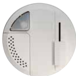
RONDÓ B LED Cod. RL5618/LED (10 pz)