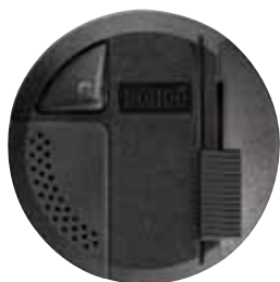
RONDÓ N LED Cod. RS5600/LED (50pz) Cod. RL5600/LED (10 pz)

* Max 10 lampadine LED - Max 10 LED lamps